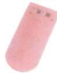
Tuile écaille grand moule 17 x 38 cm