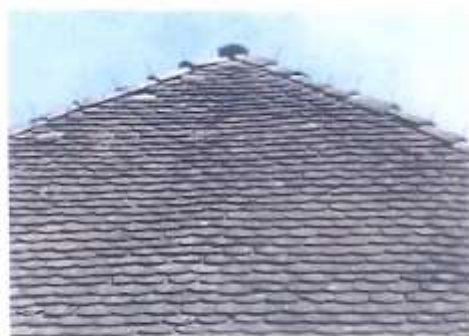
Couverture de tuiles en "queue de castor"

Les tuiles seront de teinte brun, rouge-brun ou rouge vieilli. Elles pourront éventuellement être panachées (3 couleurs minimum) si cela participe à l'intégration de la couverture dans son environnement.