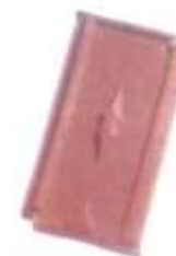
Tuile mécanique losangée