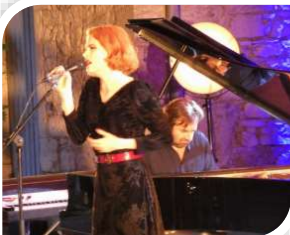
André Manoukian & Elodie Frégé

Du 18 au 27 juin, s'est déroulé le festival de théâtre du Solstice de Brangues, porté par la communauté de communes des Balcons du Dauphiné. Cette année encore, le château Paul Claudel de Brangues a accueilli la plupart des représentations.