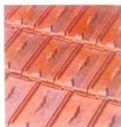
Couverture en tuiles mécaniques losangées