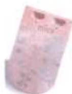
Tuiles en "queue de castor" petit moule 17 x 27 cm