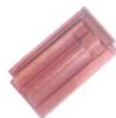
Tuiles mécanique à côtes

J'ai un projet, je demande conseil à la mairie, avant toute autre démarche !