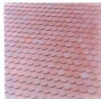
Couverture de tuiles écaille